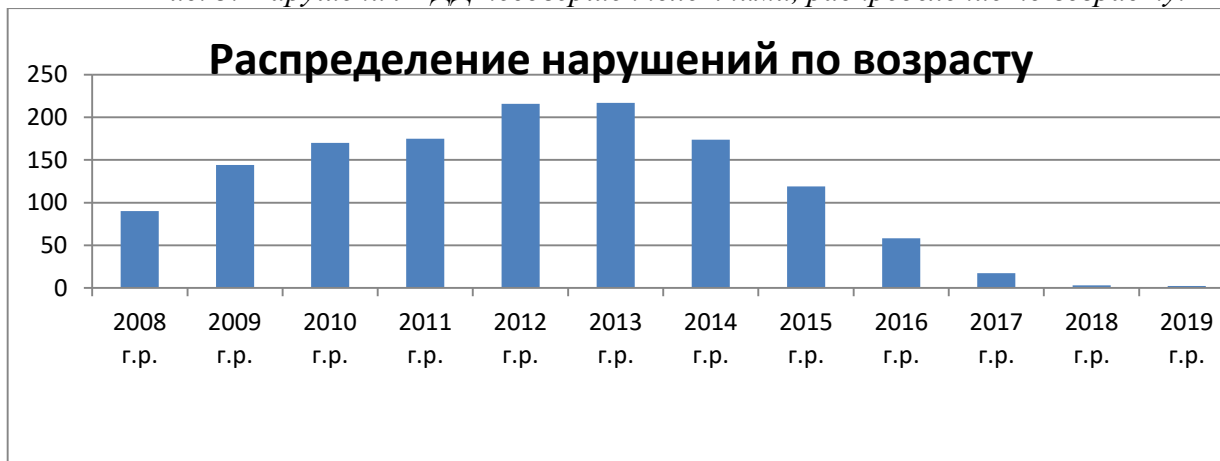
Рис. 3. Нарушения ПДД несовершеннолетними, распределение по возрасту.

Сделав выборку по образовательным учреждениям, было выявлено, что учащиеся следующих красноярских учебных заведений, а именно: