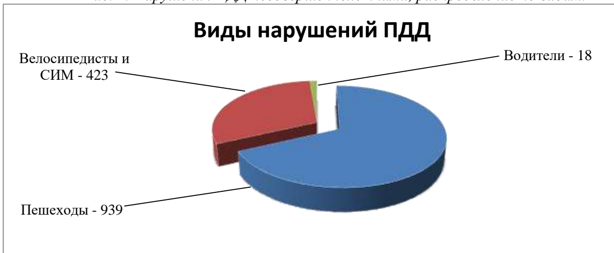
Рис. 2. Нарушения ПДД несовершеннолетними, распределение по видам.

Анализируя возрастные характеристики несовершеннолетних, нарушивших ПДД, можно сделать вывод, что к группе риска относятся дети 10-13 лет, которые характеризуются стойкими проявлениями «переходного возраста», психофизиологическими изменениями личности и импульсивностью поведения (рис. 3).